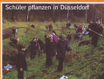
Schüler pflanzen in Düsseldorf