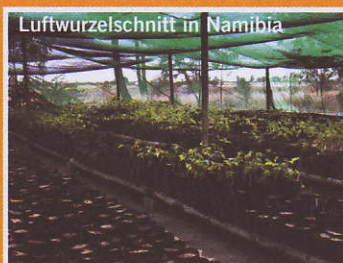
Luftwurzelschnitt in Namibia