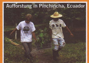
Aufforstung in Pinchincha, Ecuador